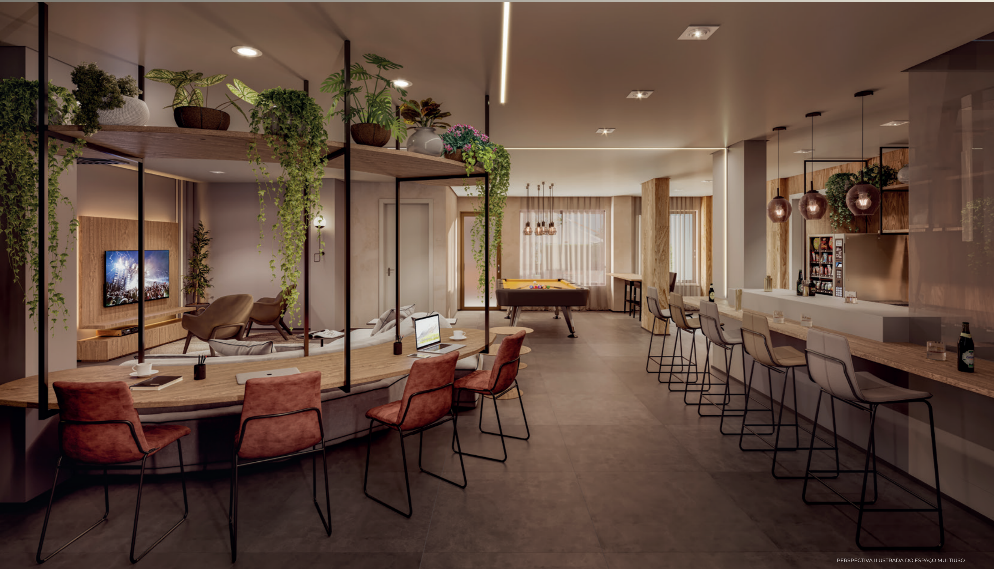
PERSPECTIVA ILUSTRADA DO ESPAÇO MULTIÚSO