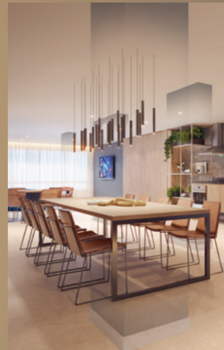
20 O PROJETO