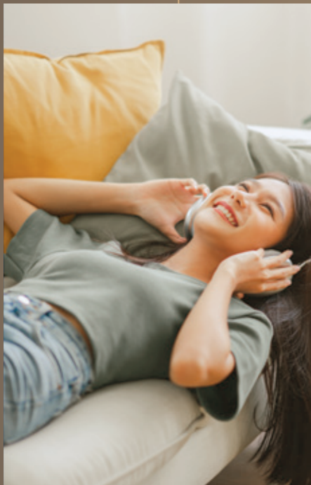
04 LIVING IN