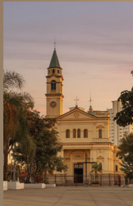
06 O BAIRRO